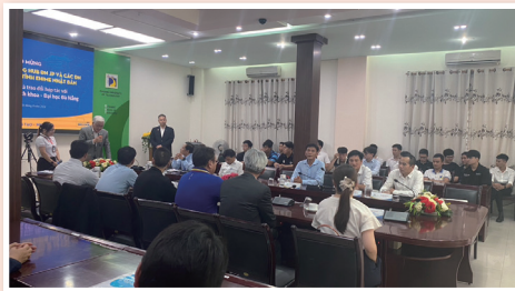
▲2024年8月開催の様子 / 学生20名が参加

ダナン大学訪問 教授及び学部生に向けた企業・求人説明、校内見学など Hub-ダナン訪問 日本語クラス、事前教育などの説明 ※ダナン市・ホイアン市の観光を組み合わせる場合、観光ガイドをご紹介することができます。