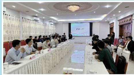
▲2023年11月開催の様子 / 学生33名が参加

【大学概要】 国立ダナン大学(UD) HP https://www.udn.vn/english 創立年1994年。1994年4月4日に政府によって設立されたベトナム中央地域で最大規模の国立総合大学。傘下大学: 工科大学、経済大学、教育大学、外国語大学、技術教育大学、情報通信技術大学、学生数: 学部学生55,000人 大学院生5,000人以上